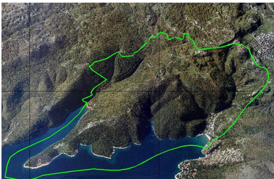
Grafički prikaz 1.

Područje između uvale Maslinica (Rabac), Labina i Prtloga zaštićeno je kao značajni krajobraz Rješenjem Republičkog Zavoda za zaštitu prirode, br. Up/I 27/1973. Površina zaštićenog područja je 1121,5 ha, karakterizira ga bogatstvo raznolikih i vrlo vrijednih osobina (grafički prikaz 1.). Obalnu zonu odlikuju slikovite uvale, među kojima su najveće i najzanimljivije uvala Rabac i uvala Prklog. Staro naselje Labin vrijedan je spomenički ambijent. Poput mnogih istarskih gradova nalazi se na povišenom, dominantnom položaju, posebno lijepih vizura. Vegetacija ovog područja također je neobično značajna. Posebno se to odnosi na obalni pojas između Rabačke uvale i rta Sv. Jurja.